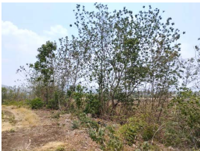
แนวเวนไม่ทำเหมือง