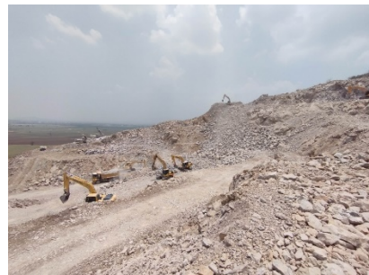
หน้าเหมืองปัจจุบัน