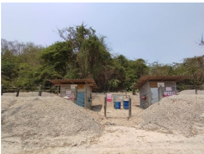
อาคารเก็บวัตถุระเบิด