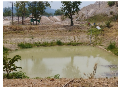
บ่อดักตะกอน