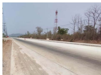
เส้นทางเข้าสู่โครงการ